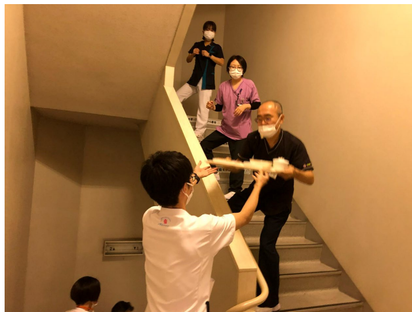
【職員による配膳リレー】